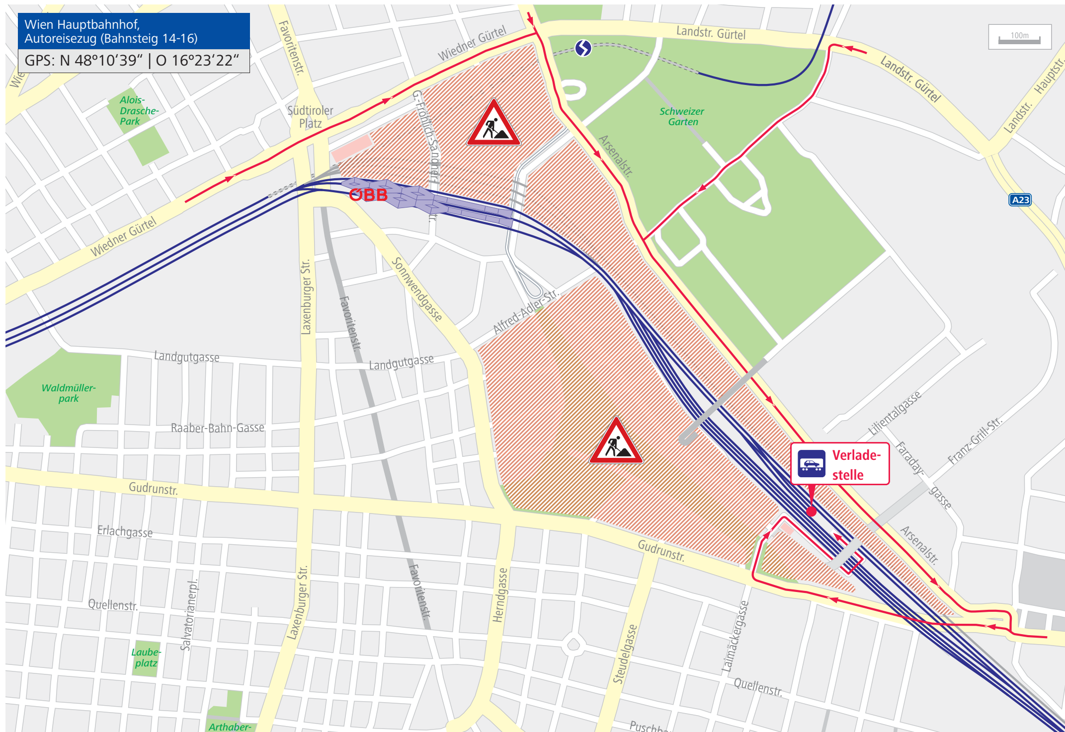
Grafik: Baumgardt Consultants

Alle Informationen zur aktuellen Verkehrslage stehen Ihnen gesammelt in der ÖBB-Streckeninformation streckeninfo.oebb.at zur Verfügung. Die Zufahrtskarten stehen Ihnen auch im Internet unter autoreisezug.oebb.at zum Download zur Verfügung.